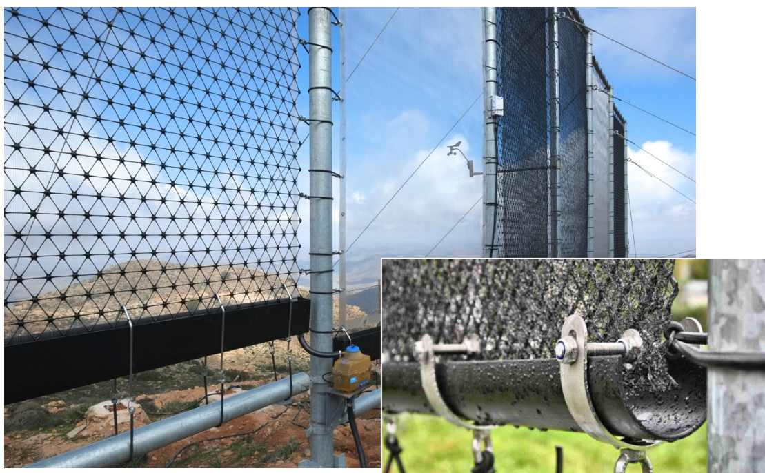
Nebelfänger im Einsatz